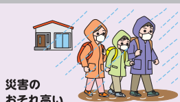
災害の おそれ高い