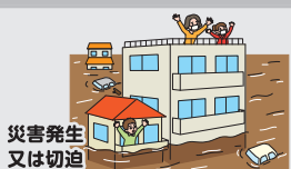
災害発生 又は切迫