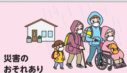
災害の おそれあり