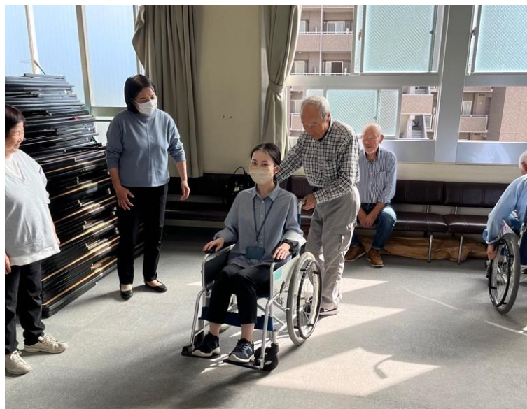
【要支援者の避難支援を考えよう】