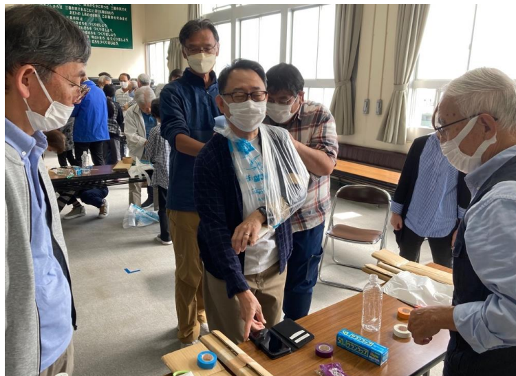
【市民トリアージと身近なものを使った応急手当】