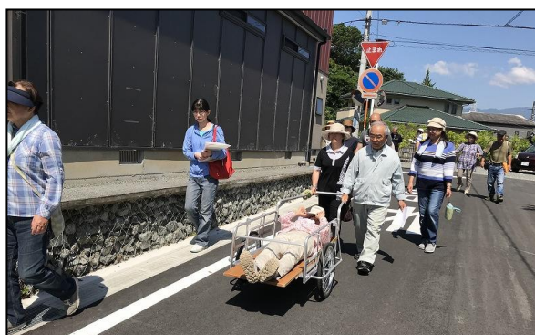
【平成30年富士ビレッジ自治会での避難の様子】