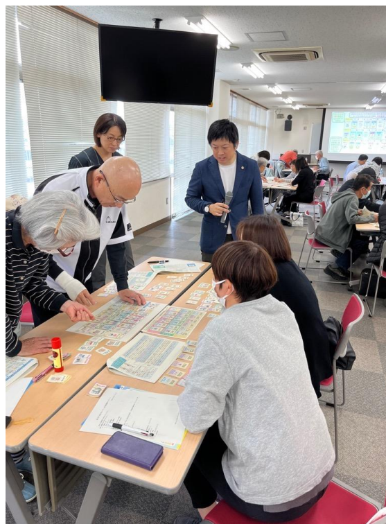
【被災後の生活再建～支援制度の徹底活用】