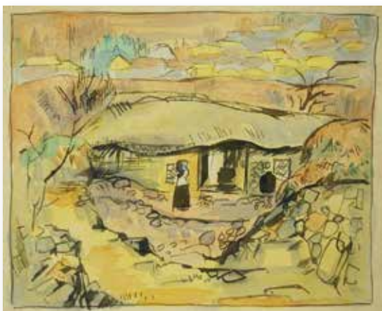
「朝鮮風景画」(個人蔵)