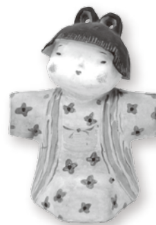
三四呂人形「里子」(個人蔵)