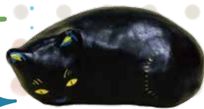
三四呂人形「黒猫」(個人蔵)