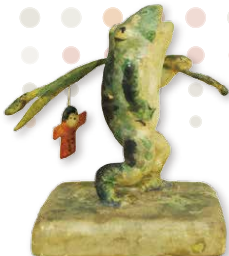
三四呂人形「てるてる坊主」