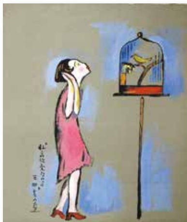
「鳥籠を見る女性」私この頃変なのよ” (個人蔵)