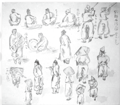
「朝鮮風俗 男の巻」(個人蔵)