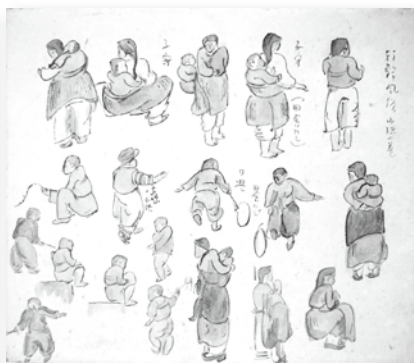
「朝鮮風俗 小供の巻」(個人蔵)