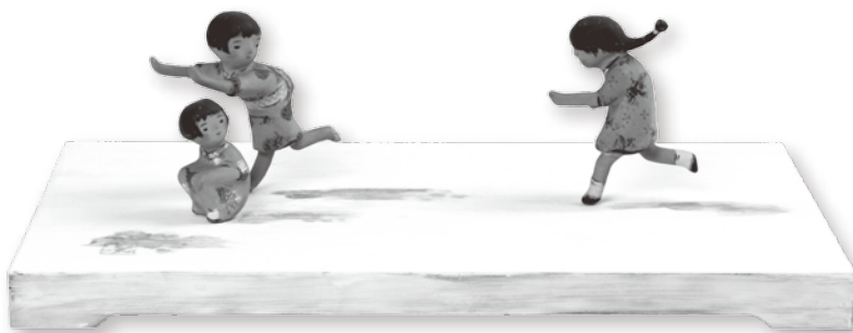
三四呂人形「影ふみ」(個人蔵)