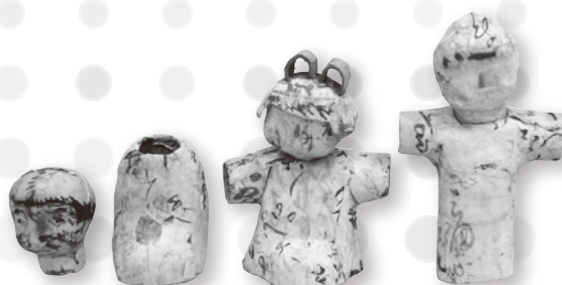
三四呂人形制作工程(個人蔵)