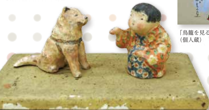
三四呂人形「ハチ公」(個人蔵)