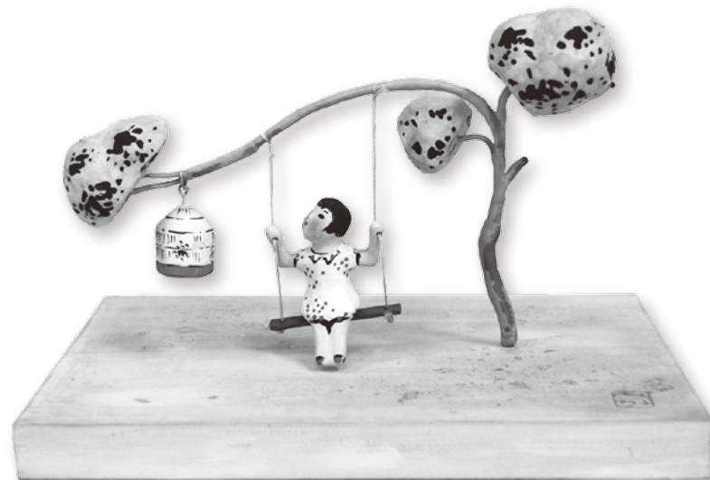
三四呂人形「春日庭」