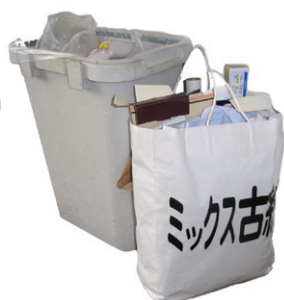
燃えるごみの箱の横に紙袋を用意する