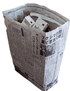
新聞紙で袋を作る