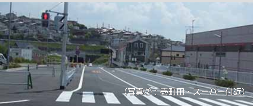
(写真⑦：壱町田・スーパー付近)