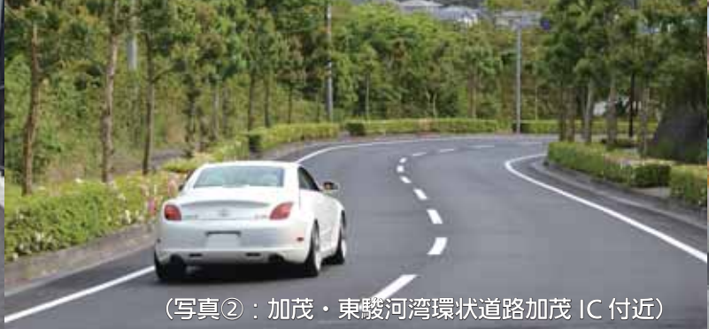
(写真②：加茂・東駿河湾環状道路加茂 IC 付近)