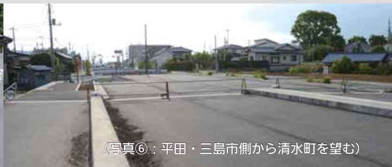
(写真⑥：平田・三島市側から清水町を望む)