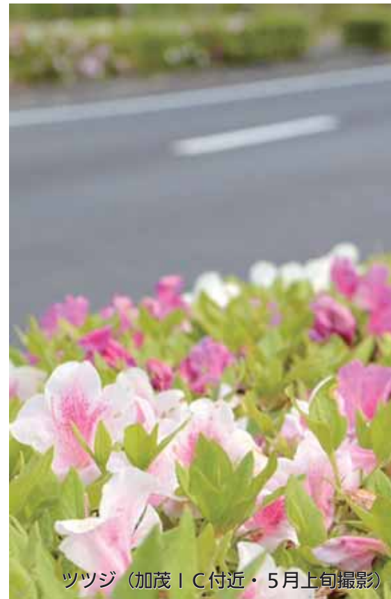
ツツジ（加茂IC付近・5月上旬撮影）