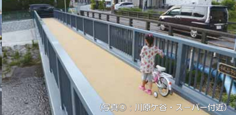
(写真④：川原ヶ谷・スーパー付近)