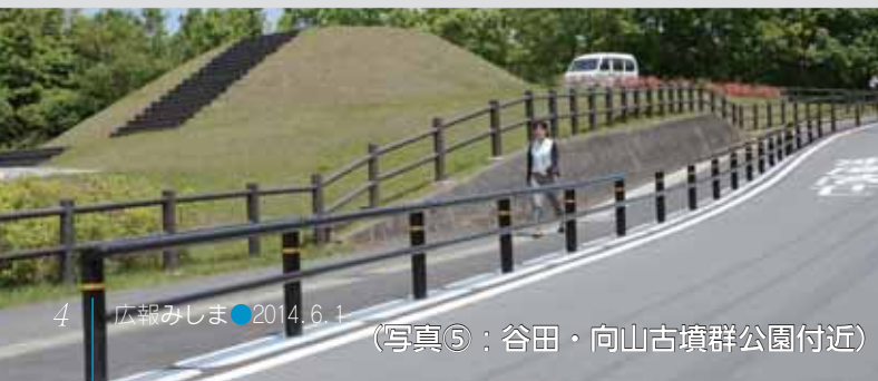
(写真⑤：谷田・向山古墳群公園付近)