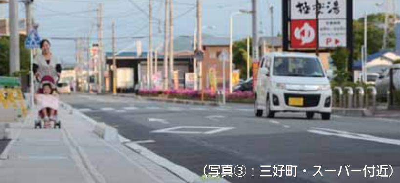
(写真③：三好町・スーパー付近)