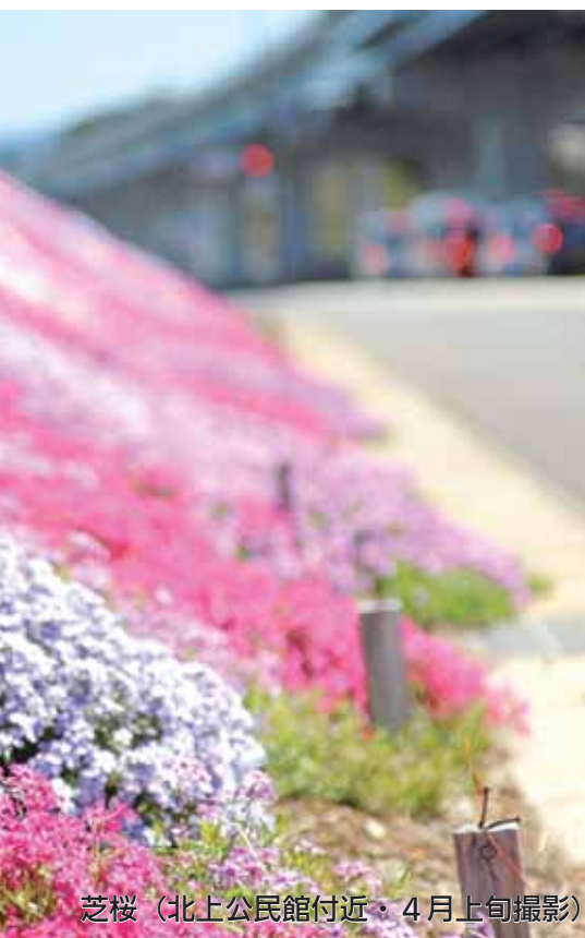
芝桜（北上公民館付近・4月上旬撮影）