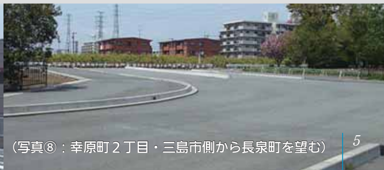
(写真⑧：幸原町2丁目・三島市側から長泉町を望む)