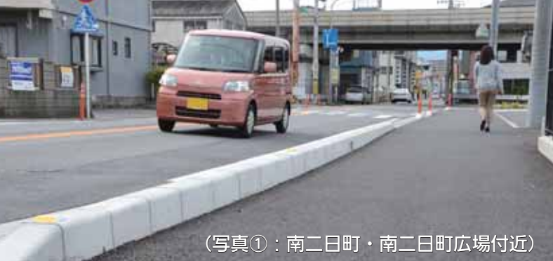
(写真①：南二日町・南二日町広場付近)