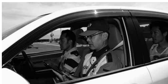
▲エコドライブの注意点を踏まえた運転練習

6月14日(土)、東部運転免許センターで、エコドライブ講習会が行われました。自動車に燃費計を付けて、受講前の運転とエコドライブ講習後の運転とを比べました。結果、受講前の運転に比べて、15人の平均で、二酸化炭素は、約26%減少し、燃費は約37%改善されました。エコドライブは環境だけでなく、家計にも優しい運転です。