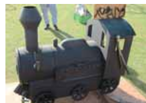
▲機関車型焼き芋機

内容 エコリーダーが作る焼き芋（機関車型焼き芋機）、楽寿の森商店街（伊豆または地元の食材を使用した季節に合う料理）、世界の食めぐりコーナー（肉まん、 しお 潮かつうどん、みしまコロッケ、ミネストローネ、カレーなど）