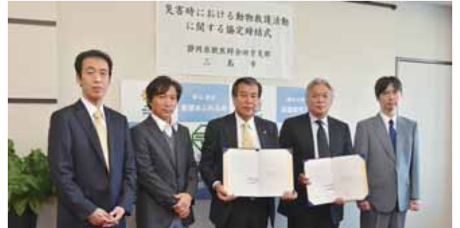
▲公益社団法人静岡県獣医師会田方支部の皆さんと豊岡市長