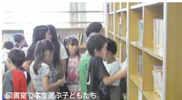
図書室で本を選ぶ子どもたち