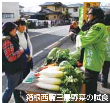
箱根西麓三島野菜の試食