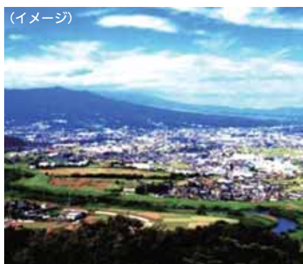
▲日守山公園から望む景色