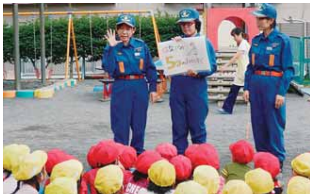
▲園児対象の花火教室

入団資格 市内在住・在勤・在学中の18歳以上の女性 活動内容 地域の防火指導や広報活動、応急手当の普 及活動