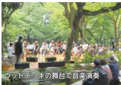
ウッドデッキの舞台で音楽演奏