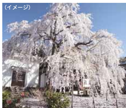
▲龍源院のしだれ桜

▶原木駅(スタート)→蛇ヶ橋→肥田神社→日守山公園入口→日守山公園(大嵐山山頂)→日守山公園入口→山本食品→興聖寺→仁田さくら公園→湯～トピアかなみ(ゴール)