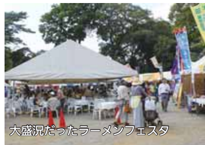
大盛況だったラーメンフェスタ