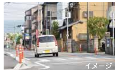
▲急ぎがちな右折時でも安全確認を