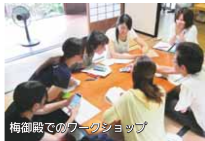
梅御殿でのワークショップ