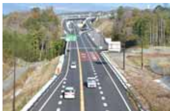
▲東駿河湾環状道路開通で、交通の住み分けが図られている傾向

平成26年中の市内の人身交通事故件数は3年連続減少、負傷者数は2年連続で減少しましたが、死者数は5年ぶりに増加となりました。