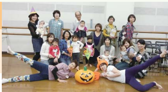
▲昨年はハロウィンやクリスマスパーティーも開催