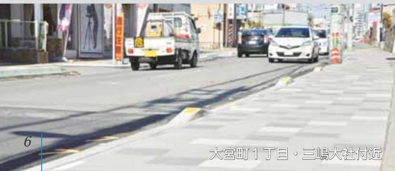
大宮町1丁目・三嶋大社付近