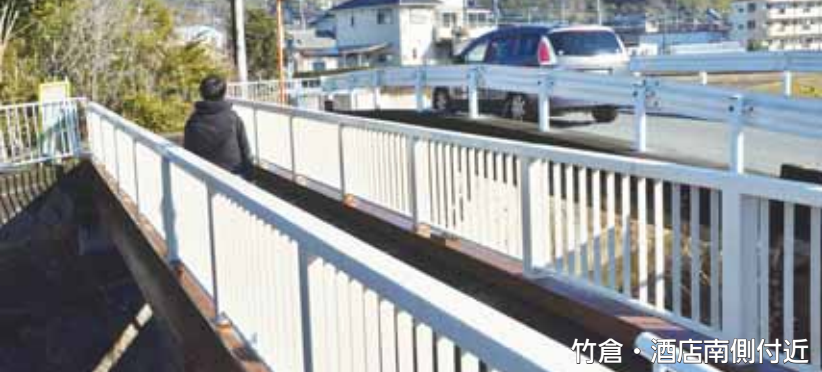
竹倉・酒店南側付近