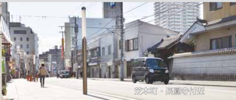
芝本町・長圓寺付近