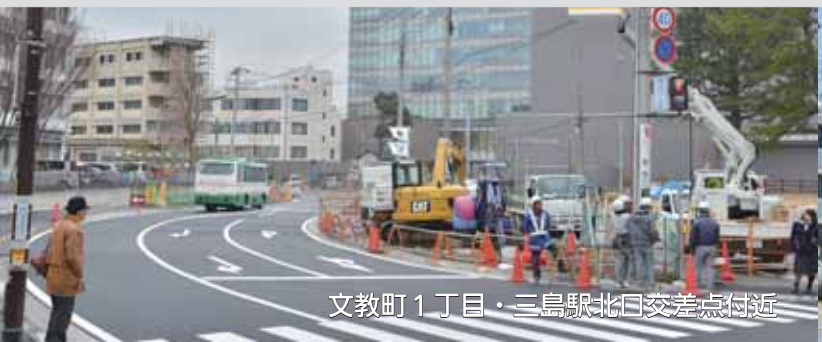
文教町1丁目・三島駅北口交差点付近