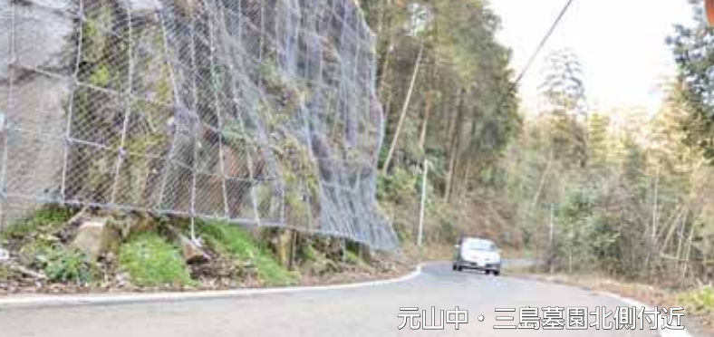
元山中・三島墓園北側付近