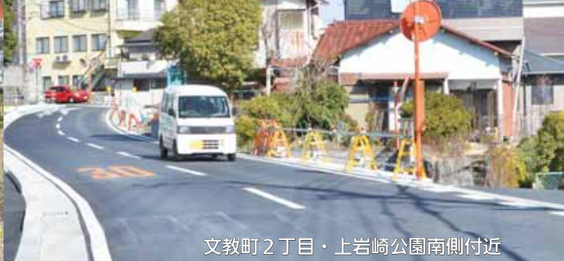
文教町2丁目・上岩崎公園南側付近