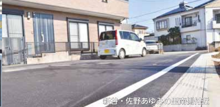
新谷・佐野あゆみの里南側付近