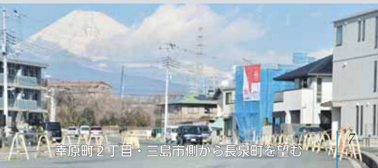
幸原町2丁目・三島市側から長泉町を望む