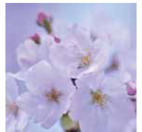
▲多種の桜も見どころ

問合せ 国立遺伝学研究所 (☎981-5873、ホームページ http://www.nig.ac.jp/koukai/koukai2015/ 、観光協会 (☎971-5000)、商工観光課 (☎983-2656)