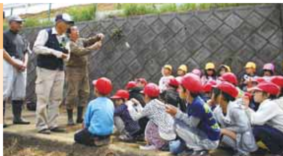
▲農事体験支援。土作りから収穫まで手間を惜しみません