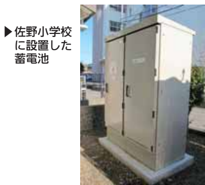
▶佐野小学校 に設置した 蓄電池