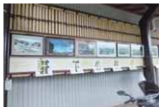
▲四季折々の写真を飾る軒下の美術館

との協働で、ウォーキングコース沿いなど、ハイカーが通行する場所の軒下に坂地区(五ヶ新田)の風景や写真を飾る「軒下の美術