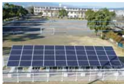
▲長伏小学校に設置した太陽光パネル