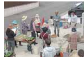
▲オープンガーデン講習会