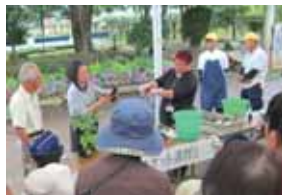
▲ハンギングバスケット作製講習会