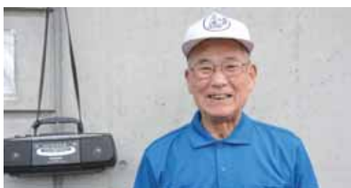
▲黒石さん 仲間と楽しむことも継続の秘訣