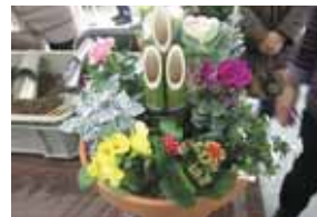
▲正月用寄せ植え作製講習会