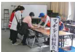
▲ボランティア受け入れ訓練

大災害の発生時、市内外から来るボランティアの人たちを受け付け、支援を必要とする被災者を紹介する仲立ちの役割をしています。平成10年に活動を開始し、退職者や自営業者、主婦など24人が参加しています。ボランティア本部開設訓練などを実施したり、近隣市町の団体と連携し活動をしています。また、「いざというときに、行政の目が行き届かないところで困っている人を助ける」という信念が活動の支