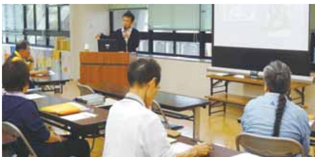
▲専門家による講義や参加者の状況にあわせた個別相談も魅力