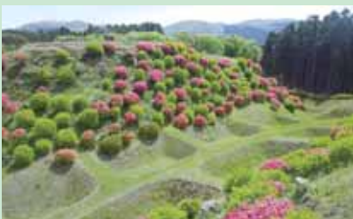
④障子堀 ツツジは5月中旬が見ごろ