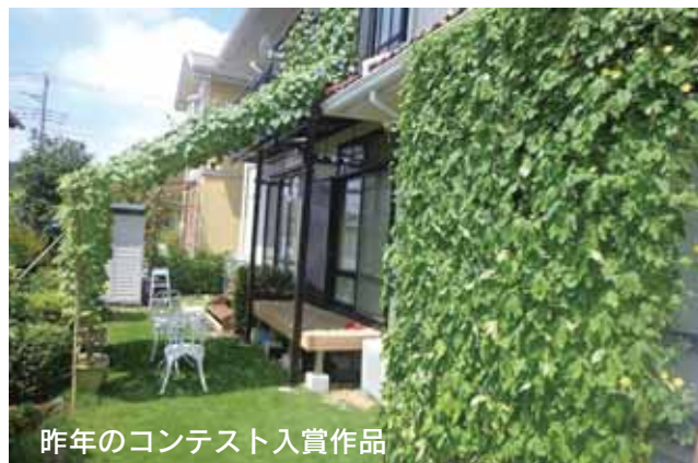
昨年のコンテスト入賞作品