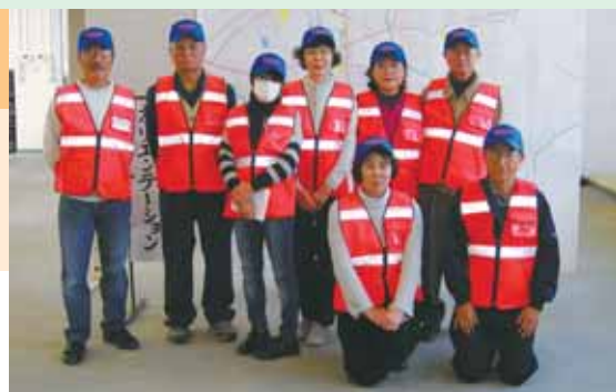
▲月1回の会議に加え、定期的に訓練を実施