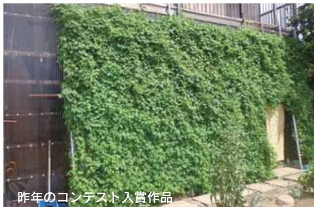
昨年のコンテスト入賞作品

夏の日よけや葉の蒸散作用で自然の冷房効果があります。エアコンの節電につながるだけでなく、見た目にも涼しく花や実を楽しむこともできます。