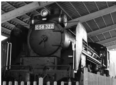
▲子どもたちに大人気のS L