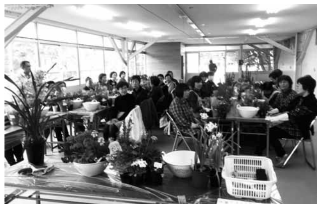
▲ガーデニング教室の様子