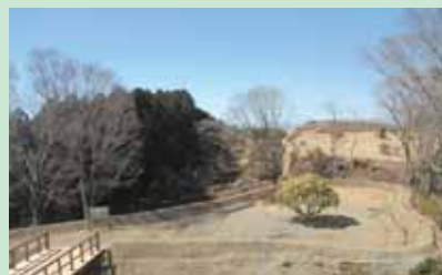
②西やぐら・西の丸 平成25年度に修復