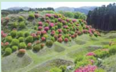
④障子堀 ツツジは5月中旬が見ごろ