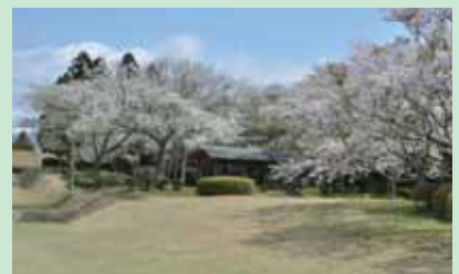
③岱崎出丸のサクラ 4月中旬が見ごろ