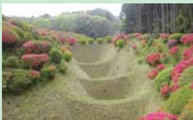
①敵堀 畑の畝のような形状が特徴