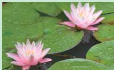
⑤箱井戸の睡蓮 5月中旬から見ごろ