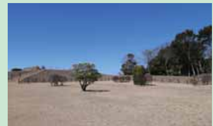
⑥広い芝生はピクニックに最適◎