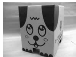
▲だっくす食ん太くんNEO