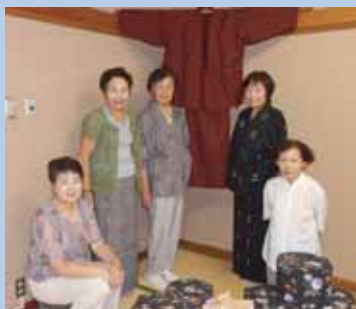
リフォームした和服(奥、会員着用)と、牛乳パックから作った椅子(手前)