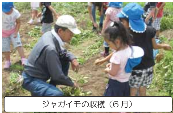
ジャガイモの収穫（6月）

また、収穫した野菜を利用して作ったじゃがバターやヤキイモ等を「三島パサディナ夏祭り」や「みしま秋まつりフードフェスティバル」で販売しています。