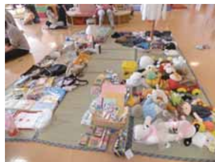
第一回おゆずり会の様子

クイズの答え：①の汚れたり濡れたりした衣類、⑥の靴、⑦の座布団や布団類、⑧のかばんは回収に出せません。ご注意ください。