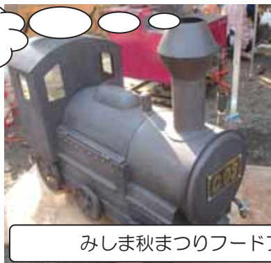
みしま秋まつりフードフェスティバル 2014 への出店（11月）