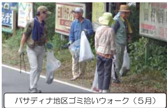
パサディナ地区ゴミ拾いウォーク（5月）

活動開始当初よりごみは減りましたが、依然としてなくなりません。ごみ拾いを通じて人の輪（和）も広がれば・・・と願いつつ、これからも続けていきたいと思ひます。