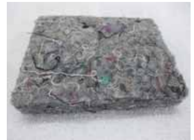
自動車用のフェルト

衣類回収ボックスに入れられた衣類は、回収業者により集められてリサイクル工場に引き渡されます。その後、衣類として再利用できるものとできないものに大別され、再利用できるものは海外（東南アジアなど）で販売されます。再利用できないものは、機械清掃用ウエスや自動車用の床マットなどの工業製品にリサイクルし有効に使用されています。