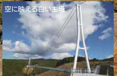
空に映える白い主塔