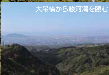
大吊橋から駿河湾を臨む