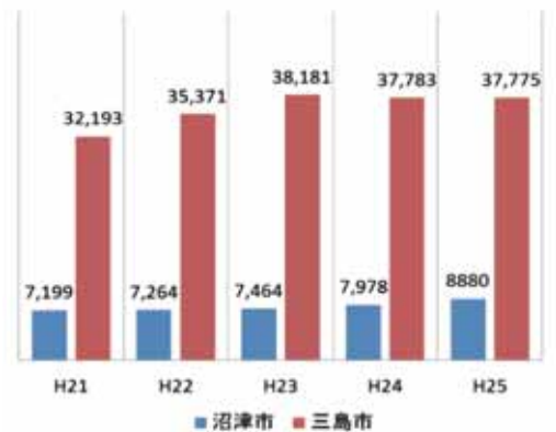
年間の搬入台数(生活系)