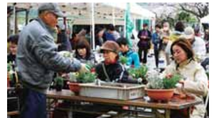
▲春の日差しの中、お楽しみください