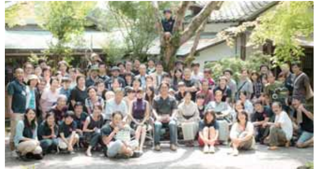
▲スタッフ丸となって作品づくりに取り組みました

問合せ 商工観光課 (☎983-2766)、みしまびとプロジェクト事務局 (☎090-7680-2099)