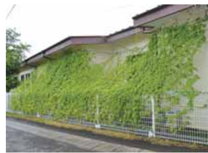
▲昨年度 幼保の部(会長賞): 坂幼稚園