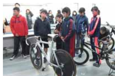
▲みしまジュニアスポーツアカデミー