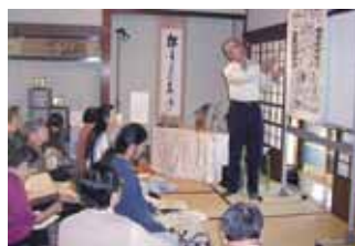
▲来館者に暦の案内をします

毎週金曜～日曜日に三嶋暦師の館で建物や暦の案内、1年に8回のイベント開催、小学校への出前講座の実施、書籍・カレンダー・絵葉書などを作成しています。