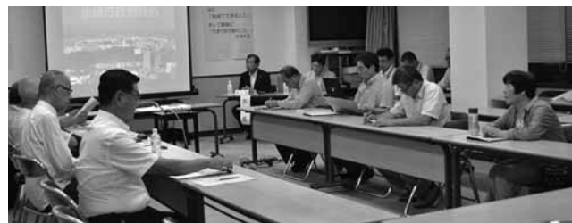
▲昨年度も貴重なご意見をいただきました

申込み・問合せ はがき、電話、FAXまたは電子メールで、参加希望日、住所、氏名、年齢、電話番号を行政課(〒411-8666北田町4-47、☎983-2615、FAX973-5722、✉gyousei@city.mishima.shizuoka.jp)へ。※当日の飛び入り参加も可能です。