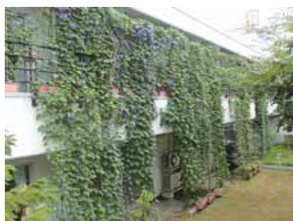
▲昨年度 団体の部(最優秀賞): 御寿園