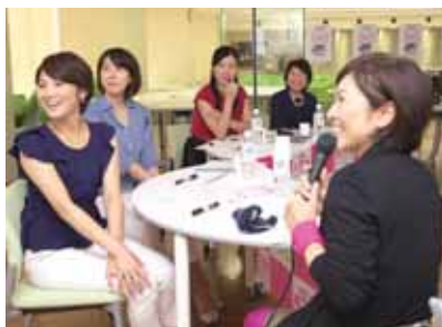
▲平成27年度事業採択団体（H i P s）

【具体例】 移住希望者を対象とした自然や文化・農業などの体験活動の提供、未婚男女を対象とした出会いの場の提供、妊娠期・出産・子育て期の各ステージに対応した体験型事業、子どもの学習支援・食事支援など