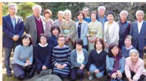
▲私たちが三嶋暦の面白さをお伝えします

研修や見学会で会員同士の親睦を深めること、活動の中で年間4,000人近くの来館者と出会い会話できること、さらに再度来館した人と再会できることにやりがいを感じています。