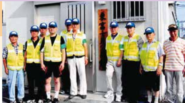
▲地域を見守る“目”です