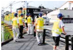
▲車には気を付けましょう

毎月第3月曜日に、子どもたちの交通安全や、ひったくりなどの犯罪を防止する、定例の町内パトロールを行っています。また、犬の散歩などのついでに、毎日活動している人もいます。それぞれのライフスタイルに合わせて、自由