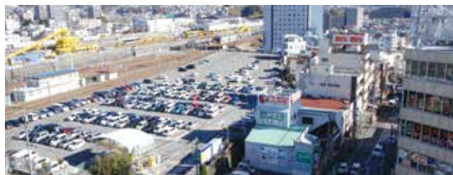
▲現在のJR三島駅南口東街区

⇒東街区は広域健康医療拠点として整備をしていきます。ご提案の内容は本事業の方向性に合致するものと考えますので、より魅力的な施設となるよう、事業計画検討の参考にしていきます。