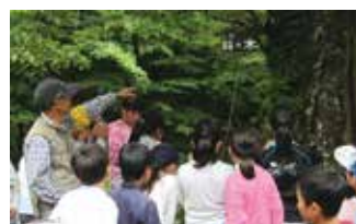
▲真剣に説明を聞きます

市内小学生の団員35人が、富士山・富士宮口五合目から六合目を目指し、富士山の保全活動を行っているガイドの人と散策をしました。普段とは全く違う自然環境に触れた団員は、標高が2,400～2,500mあり、