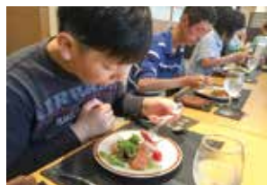
▲テーブルマナー研修

毎月第3土曜日に、佐野あゆみの里や生涯学習センターで、「外で楽しむ余暇」「魚」「防災」など、年間でテーマを決めて社会見学、調理、