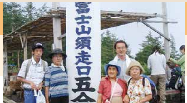
▲笑顔がまぶしい仲間たち

レクリエーション、陶芸制作、映画観賞などを行っています。また、毎年秋に日本大学国際関係学部で行われる「大学で学ぼう」に参加しています。