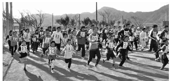
▲マラソン大会の様子

問合せ NPO法人三島市体育協会(☎981-0200、月曜・水曜・金曜日午前10時～午後4時、祝祭日を除く)、スポーツ推進課(☎987-7571)