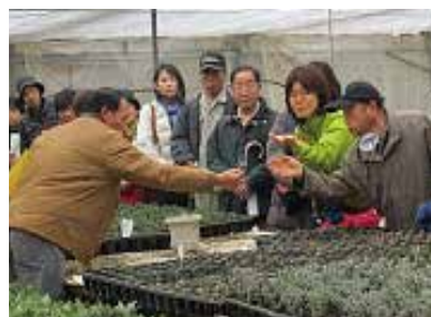
▲飲んで、食べて楽しめるハーブ

場 三島ハーブガーデン(塚原新田)ほか 内 生産者が実際に栽培しているハウスを見学し、ハーブの栽培方法や楽しみ方を学びます