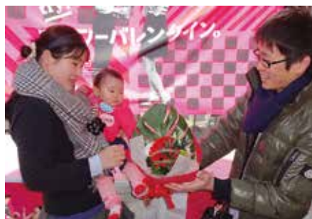
▲ 友達や家族に花言葉を添えて花束を

記念日に花を贈ろう♪2月はバ レンタインデー♪ 2月14日(火)のバレンタイン デーに、お花を贈りませんか。 愛情を表す花言葉を持つ、赤い カーネーションやバラを取り入 れたアレンジメントがお勧めで す。