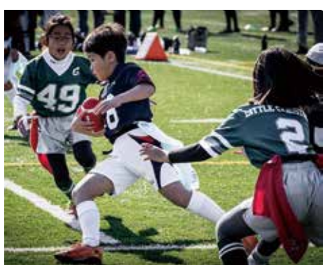
▶ボールも使い、作戦づくりも。