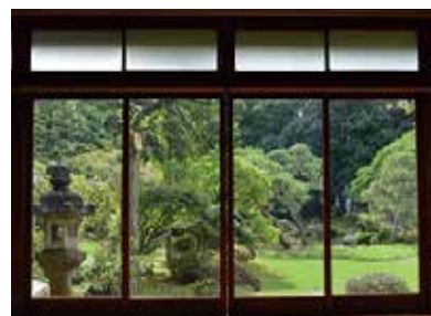
▲美しい日本庭園で作業しませんか

内 国の登録有形文化財「隆泉苑」 の日本家屋と庭園の清掃活動 対 毎週月曜日の午前中の活動に参加できる人