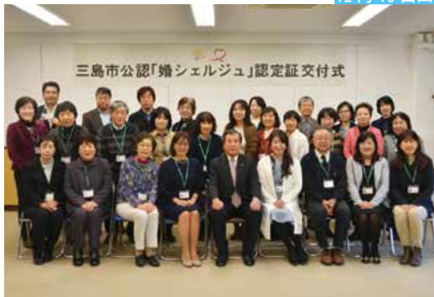
三島市公認「婚シェルジュ」認定証交付式