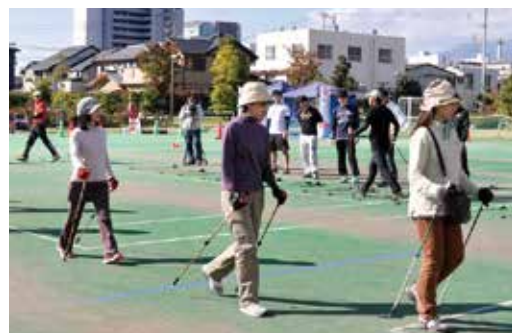
日本ノルディックウォーキング 振興会三島支部

ノルディックウォーキング&ブローライフル(P18※2参照)体験会を開催。愛好者のレベルアップと市民の健康増進を図りました。 詳細はホームページ http://www.jnwo.org/