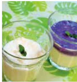
▲いつもの大根がヘルシースムージーに変身

費 500円 対 市内在住、在勤の人 定 20人※応募多数時抽選 特 エプロン、コップ、ふきん 申・問 2月13日(月)午後5時までに 坂公民館(☎ 972・6676)