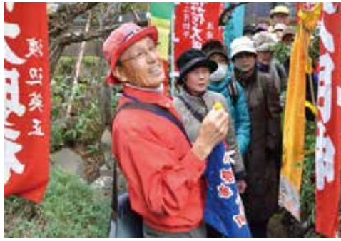
▲まちなかにひっそりたたずむお稲荷さん。今まで知らない三島の歴史・小路をガイドと巡りませんか

時 2月12日(日)受付午前10時～10時40分 受付場所 三嶋大社鳥居前 内 まちなかの開運稲荷や新しくできた田中医院の庭園(水精苑)ほかを巡ります。開運絵馬のプレゼントや甘酒・抽選会などのおもてなしがあります。