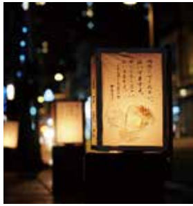
▲やさしい灯りを楽しんでください

第17回三島宿「地口行灯」展示 時 2月9日(木)～14日(火)午前10時30分～午後8時30分※点灯時間午後5時30分～8時30分 場 大通り商店街、三石神社 内 全国から寄せられた、心に染みる作品や思わずニヤリとしてしまう地口行灯が並びます。点灯時は、幻想的な雰囲気醸し出します。 問 商工観光課 (☎983・26)