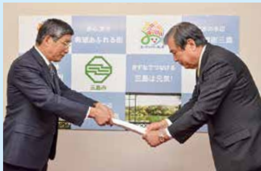
▲稲田会長から答申書を受け取る豊岡市長

今後は、市議会2月定例会に三島市水道事業給水条例などの条例改正案を提出し、審議が行われます。