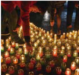
▲電気とは違うやわらかい灯り

詳しくは、市ホームページ ( http://www.city.mishima.shizuoka.jp/shinsei.html )