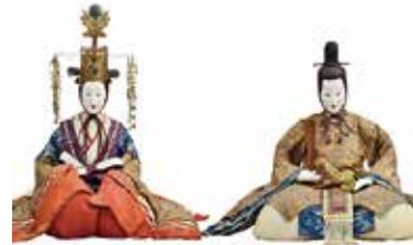
▲ 2代原舟月作「古今雜」 江戸時代後期(個人蔵)