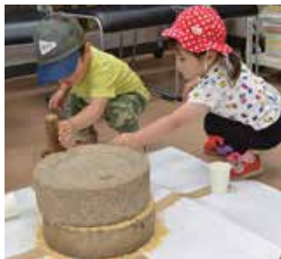
▲昔は家にあった道具 どうやって使うのかな

場 郷土資料館(楽寿園内) 内 ①昔のどうぐ(石臼・鯉節削り・和菓子の木型などの体験)②遊んで学ぼう富士山デー(溶岩観察、富士山カルタ)③江戸時代の三島宿(立版古を作ろう、三島宿を中心とし