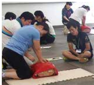
▶ 病院搬送前に CPR講習