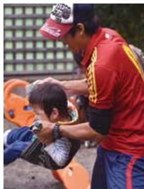
▲家にある物を使い、大きな動きの遊びをします

【申・問】2月10日(金)までに必要事項を広報広聴課(☎983・2620、kouhou@city.mishima.shizuoka.jp)