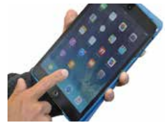
◀タブレットで好奇心を満たそう