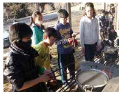
▲電気がなくてもおいしいごはんが炊けます