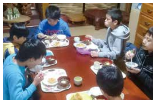
森のようちえん 太陽と緑の風クラブ

毎週月曜日に佐野地区で、火曜日に徳倉地区で、子ども食堂を開いています。 閩高橋さん (☎ 941・5357)