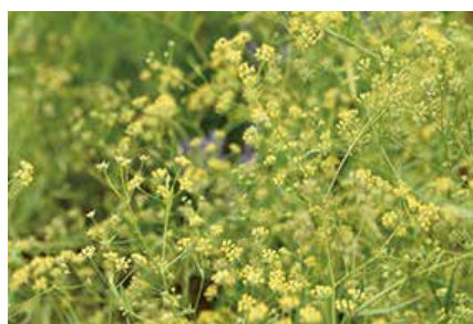
▲ミシマサイコは解熱・鎮痛作用があり、多くの漢方薬に配合される

場 市民活動センター会議室 内 ミシマサイコを栽培し、技術指導をしている講師から栽培のポイントなど聞きます。