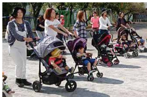
Something Orange 三島

ノルディックウォーキング&ブローライフル(P18※2参照)体験会を開催。愛好者のレベルアップと市民の健康増進を図りました。 詳細はホームページ http://www.jnwo.org/