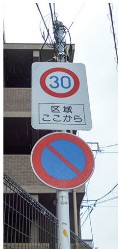
▲この表示を見たら、思いやり運転をお願いします