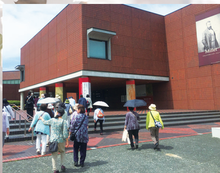
▲昨年5月の野外学習の行先は山梨県立美術館など