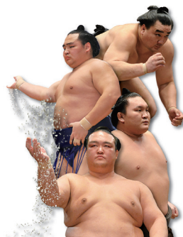
▲普段できない体験を