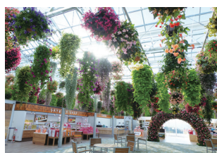
▲スカイガーデン(アンテナショップ)の外観と内観