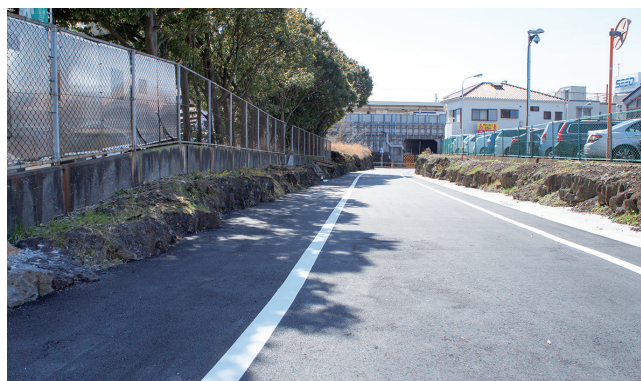
▲三島駅北口の引き込み線が道路になりました