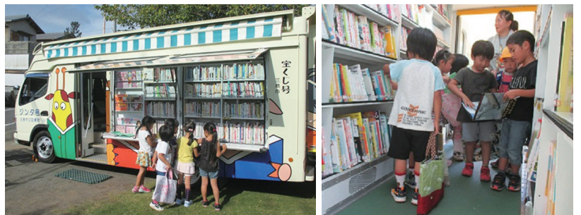
▲約3,000冊の本を載せた移動図書館「ジント号」、月に一度をお楽しみに