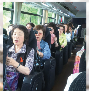
▲毎年違ったテーマで行う野外学習は、貸し切りバスで移動