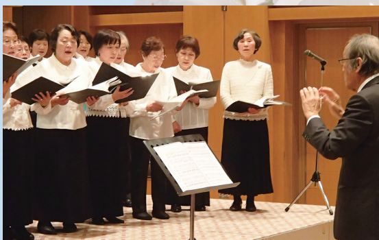
▲2月の「生涯学習まつり」でグループ学習の成果を発表