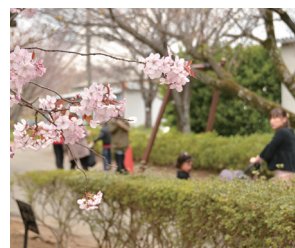
▲構内の約200種類の桜を見て回ることができます