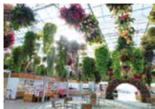
▲スカイガーデン(アンテナショップ)の外観と内観