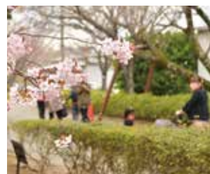
▲構内の約200種類の桜を見て回ることができます

☎ 981・5873、☎ 981・6707 問商工観光課 ☎ 983・2656 問観光協会 ☎ 971・5000