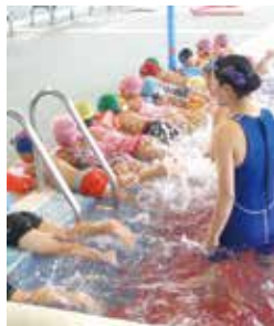
▲みんなと一緒に水と仲良くなろう