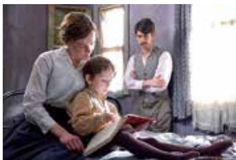
苦戦しながらも参政権獲得を目指した女性たち

申・問 7月19日(水)までに下の【基本事項】を静岡県男女共同参画センター交流会議 ☎ 054・250・8147、FAX054・251・5085、✉ azareachiiki@gmail.com