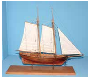
▲ 両国間のさまざまな困難を乗り越え完成したヘダ号

対 小学5・6年生 定 先着25人 ■ 共通事項 申 ① 7月14日(金)まで ② 7月24日(月)までに日本学術振興会ホームページ「ひらめき☆ときめきサイエンス」 問 文化振興課 ☎ 983・2756 問 日本大学国際関係学部 ☎ 980・0808