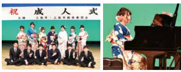
▲自分たちの手で思い出に残る成人式を

成人式の実行委員（新成人）を募集します。 成人式日程 平成30年1月7日(日) 時 8月～平成30年1月（月1回程度） 場 生涯学習センター 対 平成9年4月2日～平成10年4月1日生まれの新成人で、8月から生涯学習センターで開催される実行委員会に出席できる人 申・問 7月14日(金)までに下の【基本事項】を生涯学習課 ☎ 983・0883、✉ syougai@city.mishima.shizuoka.jp