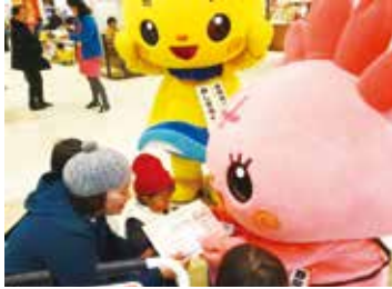
▲みしまるくん・みしまるこちゃんとの写真撮影会もあります

毎月19日は食育の日「みしまるくん・みしまるこちゃんの食育シールをプレゼント」 市では、食育の日（毎月19日）を「三島市民家族団らんの日」として、家族や友人・同僚との食事や団らんの時間を大切にする意識を高める機会としています。 時 6月28日(水)午後2時～3時30分