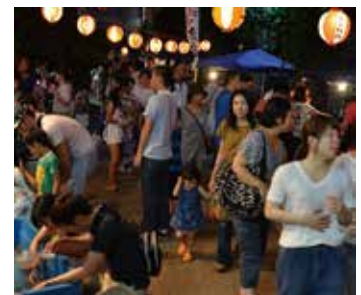
▲金魚すくいなど夜店が楽しめます