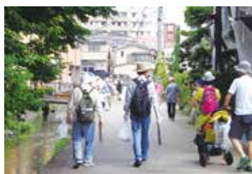
▲ウォーキングをしながら 街をきれいにしませんか

■優秀技能者表彰 「職業能力開発促進法」に基 づく国家検定制度において認 定を受けた人、技能五輪など 各種競技会で金・銀・銅を獲 得した人、事業所内の特許取 得者で特許が商品化され事業