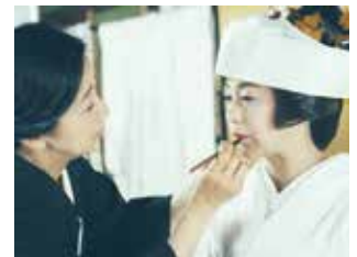
▲家族愛を丁寧に描いた作品