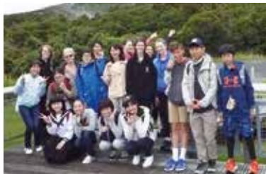
▲忘れられない体験をしました