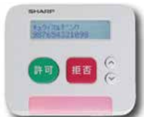
▲これで家族も安心