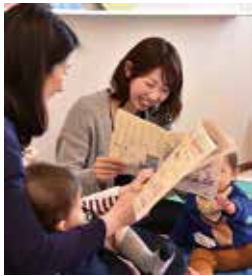
▲参加者同士の交流も