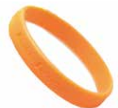
▲認知症支援の目印「オレンジリング」