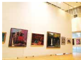
◀多種多彩な美術作品が楽しめます