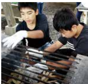
▲炊事は仲間と協力して、出来上がりの喜びもひとしお