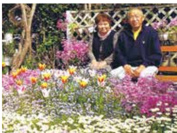
▲旅行で訪れたイギリスとニュージーランドの庭に感化されました

感じます。 持っているのだと これからも「花 サポーターみし ま」に参加して、 花の輪が広がって いくことを願って います。