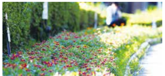
▲秋になると1万本のジニアが咲き誇ります