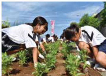
▲きれいに咲くかな