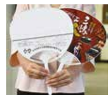
▲うちわ裏面のご確認を