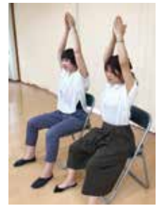
▲ひめトレで美しい姿勢を取り戻そう