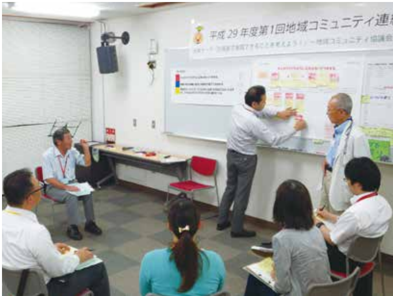
▲グループに分かれ、実践できることを考えました。