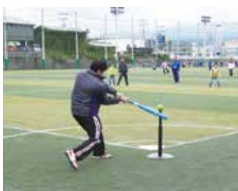
▲止まったボールを打つ、野球に似た競技。幅広い世代で楽しめます

申・問10月18日(水)までに市民体 育館備え付け申込書（市ホー ムページからダウンロード可） を直接または、FAXでス ポーツ推進課（市民体育館内）