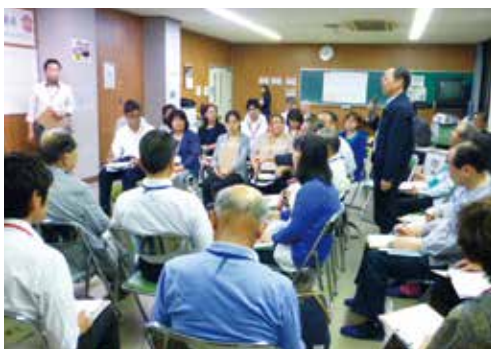
▲多くの小学校区で、子ども会の存続問題について話題に上りました。