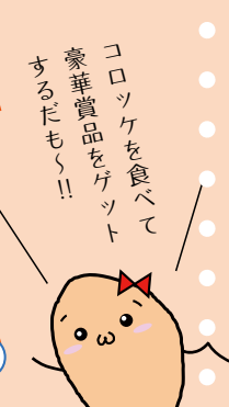
▲プレミアムみしまコロ ッケ「ダイヤモンド富士」