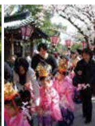
▲三嶋大社稚児行列