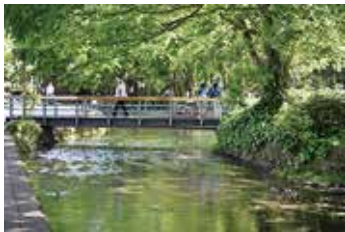
▲駅周辺の将来像について一緒に考えてみませんか

申・問 前日までに代表者の氏名、連絡先、参加人数を三島駅周辺整備推進課 ☎ 983・2633、FAX 973・7241、✉ ekishuuh@city.mishima.shizuoka.jp