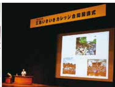
▲経験を生かし、講師として教えてみませんか