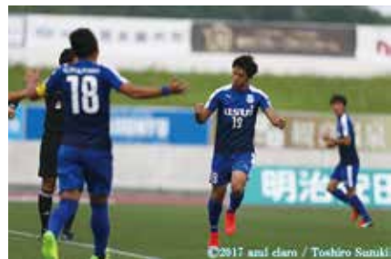
▲県東部初のJリーグチーム「アスクラロ沼津」