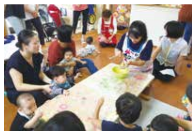
◀参加者同士の交流や保育園の様子をみることができます