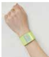
▲反射材を身に 着け事故 防止