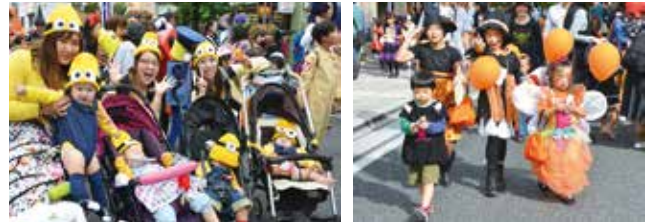
▲合言葉は「トリック・オア・トリート」