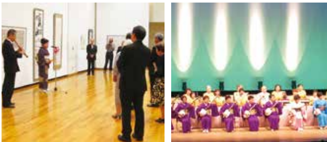
▲日ごろの活動成果を発表します