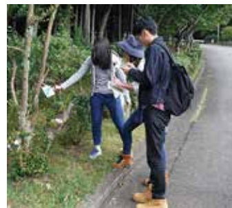
▲クイズに答えてポイントを獲得していきます