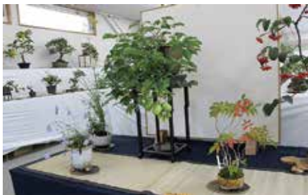
▲秋を感じるこの季節は、紅葉や果実が楽しめます