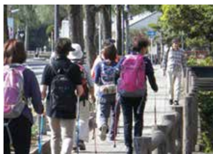
▲2本のポールを持って歩きます