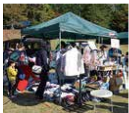
▲物を大事にする心を子どもたちと育てましょう