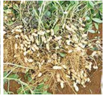
▲獲れたての新鮮な落花生が味わえます