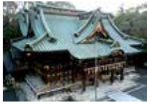
▲荘厳な雰囲気がある三嶋大社拜殿