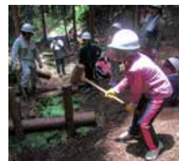
▲ダムは洪水を防いだり、森林の働きを高める効果があります