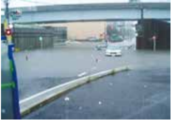
道路冠水の様子▶ (平成 20 年 7 月)