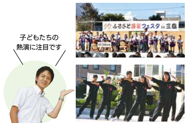
子どもたちの熱演に注目です