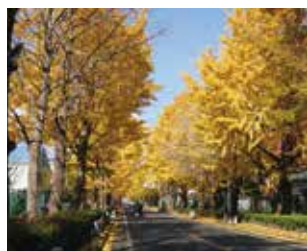
▲イチョウ並木を歩いて秋を感じませんか。

三島駅南口(スタート・受付)→菰池公園(ジオポイント)→白滝公園(ジオポイント)→源兵衛川(ジオポイント)→蓮馨寺→伊豆国分寺→ウエルシア清水町新宿店(健康チェック)→窪の湧水(ジオポイント)→山神社・原分古墳→三島車両所着発線→鮎壺の滝(ジオポイント)→大岡信ことば館(有料)→文教町イチョウ並木→日本大学国際関係学部→三島駅南口(ゴール)