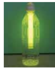
簡易ライトをペットボトルに入れたもの