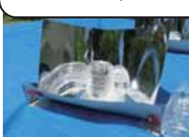
手作りソーラークッカー