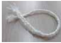
ラップを三つ編みして作ったロープ