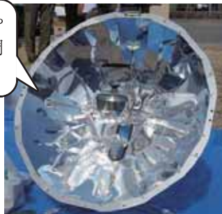
アルミ製のパラボラ型ソーラークッカー