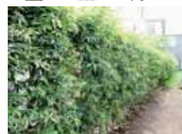
シラカシの生け垣