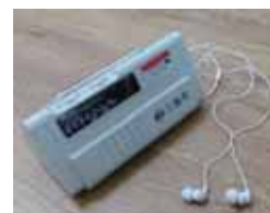
周囲に配慮が必要な場合のエチケット