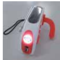
手回し・ソーラー充電機能のついたライト