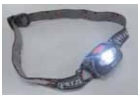
両手の空くヘッドライト

地震や豪雨などの自然現象は、人間の力ではくい止めることはできませんが、災害による被害は、少しの工夫で減らすことができます。エコライフみしま第30号では、減災に繋がる環境にもやさしい工夫や取り組みについて特集しました。