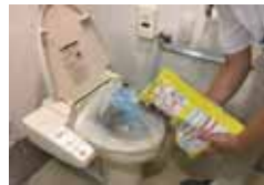
ペット用の砂を入れます

便器にごみ袋をセットし、排便後はペット用の砂を入れます。砂は匂い消しの役目をします。