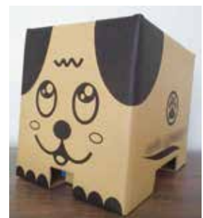
▲ペットを飼う感覚で楽しみながら生ごみを処理しませんか