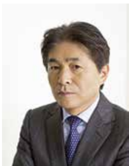
▲数々の名選手を育成

用 12月7日(休)までに下の【基本事項】を商工観光課 〆shoukou@city.mishima.shizuoka.jp、または FAX 983・2754