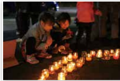
▲寒い季節だから感じる暖かさがあります