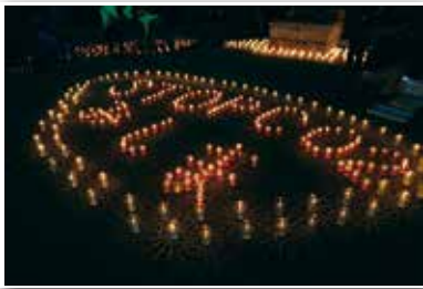
▲柔らかな光がメッセージになります