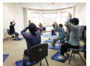
▲公民館など身近な場所で気軽に参加できます