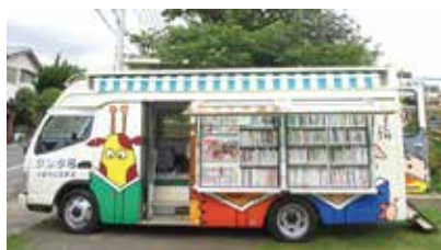
▲ジンタ号は約3,000冊の本を運ぶ

問 振替依頼用紙は市内各金融機関、郵便局、市役所にあります。 問 後期高齢者医療保険料：保