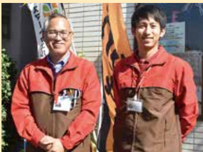
特定非営利活動法人にじのかけ橋