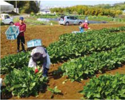
▲三島馬鈴薯の収穫作業の様子：農家の人に教えてもらいながら作業します

現在、農作業の手順を分類し、福祉施設が取り組みやすい形態に整理しています。今後は、福祉施設に広く参加を呼びかけ、障がい者の働く場の拡大と障がい者の賃金上昇を目指していきます。