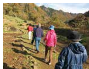
▲自然豊かな里山を散策しませんか？

養士セミナーなど費500円 定 25人(市内在住、在勤、在学の人優先) 持 動きやすい服装、タオル、飲み物、雨具、軍手 申・問 12月1日(金)までに健康づくり課