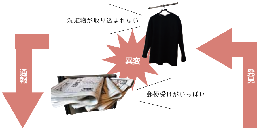
▲協定締結団体の例