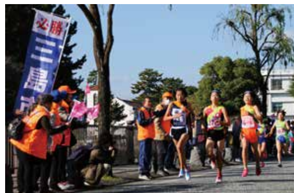
▲昨年は過去最高のタイムで9位入賞を果たしました！