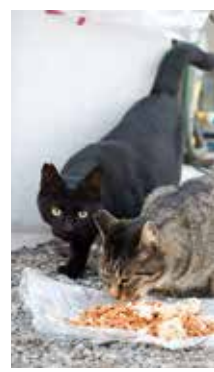
▲耳先V字カットは手術済みの証です