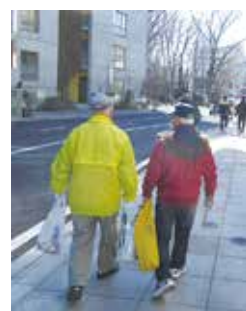
▲市内の良いところが発見できるかも