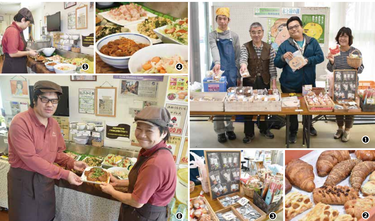
①市役所本館にて出張販売を行うフレンドシップ・イルカの皆さん②③手作りのパンやお菓子、雑貨が並び ④⑤メニューの考案から調理、接客まで自分たちで行っています⑥「サラダバー ばる」で働く2人