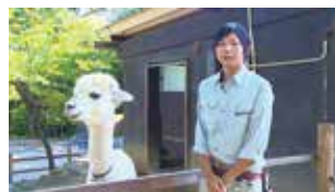
▲飼育員が動物たちの性格などを紹介

市が提供するケーブルテレビ番組「ニュースみしま」で放送中です。また、市公式YouTubeチャンネルでも見ることが出来ます。※放送スケジュールなど詳細は、市ホームページ。問広報広聴課☎983・2620