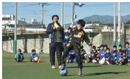
▲直接指導を受けられます