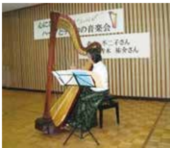
▲富士山を眺めながら生の音楽を体感しませんか