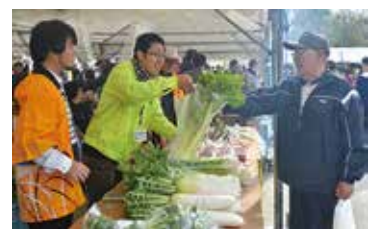
▲地元の美味しい野菜が人気です