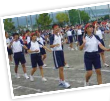
▲▶中西祭はたくさんの人で賑わいました