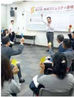
▲話し合い方法もそれぞれ