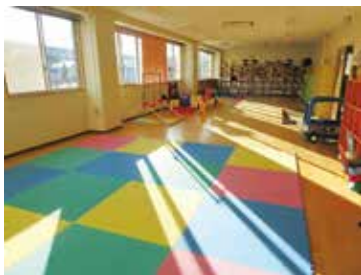
▲子育て交流室(北上文化プラザ)