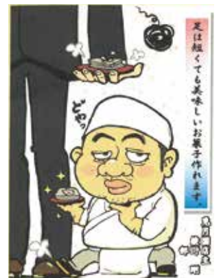
▲思わずニヤツとするキャッチコピーも楽しめます