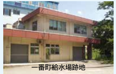
一番町給水場跡地