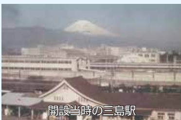
開設当時の三島駅