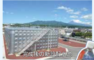
完成後の新設配水池