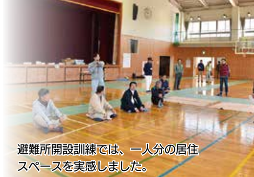
避難所開設訓練では、一人分の居住スペースを実感しました。