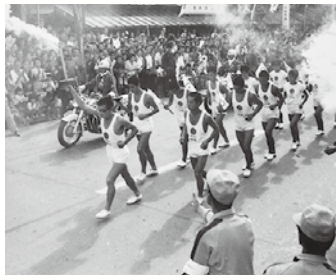
▲昭和39年(1964年)の東京オリンピックで、三島にもやって来た聖火リレー