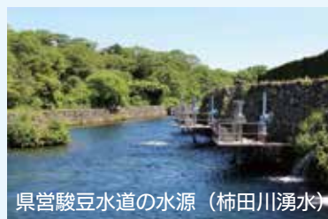
県営駿豆水道の水源（柿田川湧水）

熱海市、函南町と将来の水源確保 と地下水規制推進のため、駿豆水 道用水供給事業から購入開始