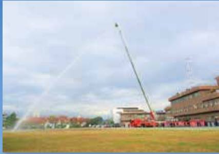
▲はしごは、11階の高さまで届く35m。 毎分2,000ℓの放水能力を誇ります。