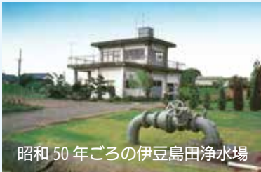
昭和 50 年ごろの伊豆島田浄水場

裾野市伊豆島田に浄水場建設。 ポンプ加圧式から自然流下式に 変更、市の平坦部全域に給水