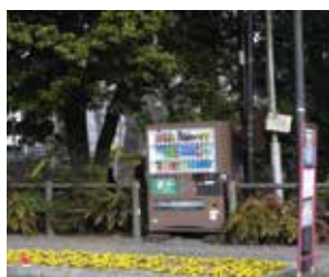
▲多くの観光客が通る道 です(白滝公園)

問 生涯学習課 ☎ 983・0883 都市公園への自動販売機の設置 事業者募集 設置場所 白滝公園、菰池公園、 上岩崎公園、長伏公園、向山 古墳群公園(各公園に1台) ※詳細は問合せ先へ 申 3月5日(月)～16日(金)までに、 必要書類を水と緑の課 ☎ 41 1・8666北田町4・47 問 水と緑の課 ☎ 983・2643