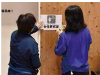
▲部屋名表示用の張り紙、養生テープなども「避難所運営グッズ」として常備

災 害時に避難する小中学校などの避難所は、上の指定避難所一覧のとおりお住まいの場所によって、あらかじめ決まっています。この機会に確認しましょう。