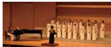
▲ステージで唱いませんか