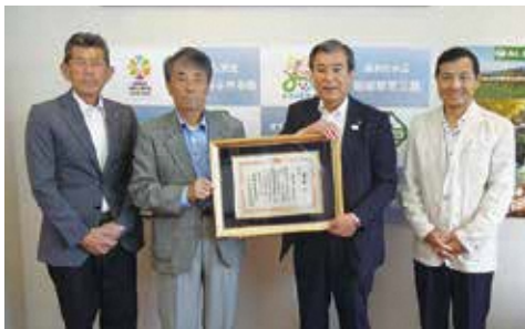
▲受賞の報告のため市長室を訪れた、中郷用水土地改良区の皆さん

この表彰は、地域農業の振興を目的に全国土地改良事業団体連合会が主催するもので、本年3月の式典では、土地改良事業を通じ地域の発展に優秀な成果をおさめた125団体と個人117人が表彰を受けました。