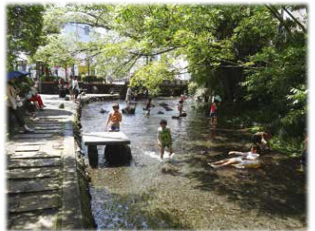
▲市民の努力で清流がよみがえった源兵衛川。夏には、子どもたちが水遊びを楽しみます。この先もずっと守ってきたい三島の宝物です。