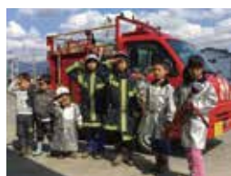
▲ミニ消防車や救急車に乗って、記念撮影できます