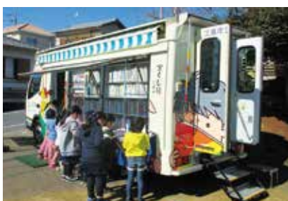
▲「ジンタ号」は約3,000冊の本を載せ市内31カ所貸し出しをしています

☞悪天候により巡回中止になる場合があります。一部指定曜日を変更する日がありますのでご注意ください。