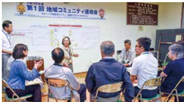
▲活発な話し合いが行われます