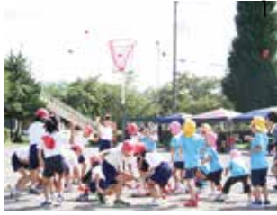
1 坂幼稚園との合同運動会

隣接している坂幼稚園とは行事や体験活動などで積極的に交流を図り、小学校入学時に環境の変化によるギャップを感じないようにしています。