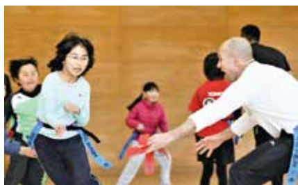
▲タグラグビーで遊びながら英語を学ぼう!