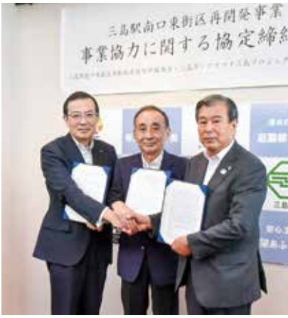
▲アスマチ三島プロジェクト共同企業体、三島駅南口東街区市街地再開発準備組合、三島市の3者で、事業協力に関する協定を締結しました。

◀ 8月28日協定締結式当日の配布資料や、協定書の内容については、市ホームページで公開中