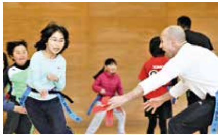
▲タグラグビーで遊びながら英語を学ぼう!