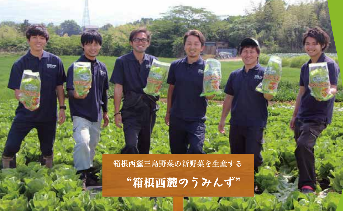
箱根西麓三島野菜の新野菜を生産する “箱根西麓のうみんず”

平成27年8月に若手生産者6人で結成した「箱根西麓のうみんず」は、タイニーシュシュやロメインレタスといった新しい作物栽培への挑戦、栽培した野菜の直接販売、産地の特性を活かした品目の提案、販売先の要望を取り入れたパッケージの提案などを行っています。今まで先輩農家さんが築いてきたブランド「箱根西麓三島野菜」の伝統を受け継ぎ、全国の誰もが知る日本一のブランド野菜を目指していきます。