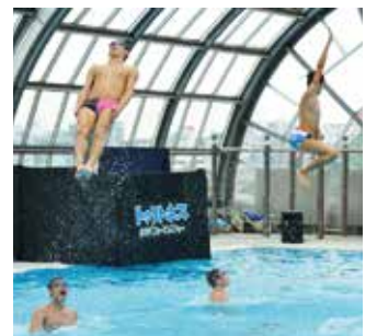
▲華麗なアクロバットでショーを盛り上げます