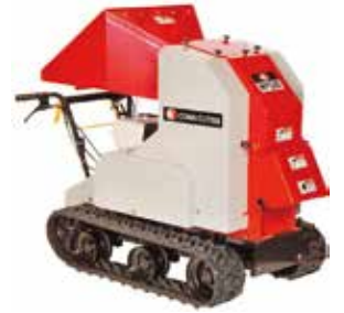
▲貸し出し用の竹破碎機