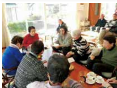
▲気ままにおしゃべりできる憩いの場

参加者に固定化傾向があること から、回覧や勧誘を行い、自治会 や他サークルとのタイアップも行 いたいと考えています。