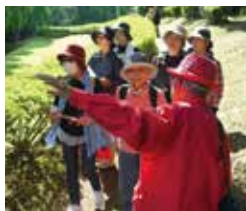
▲ふるさとガイドの会の案内で山中城跡の歴史を学びました