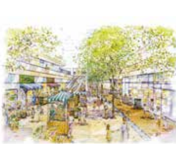
▲「水と緑の広場」イメージ

東街区とその周辺の一体的 なまちづくりや回遊性の向上 を図る新たな動線として、街 区の中ほどを東西と南に行き 来できる歩行者デッキの設置 が事業協力者から提案されて います。土地の高度利用によっ て生まれる空地と、この街 区ならではの南北の高低差を 生かし、複数棟に分かれた建 物を駅広場の高さで繋ぐデッ