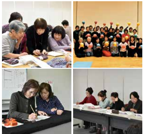
①:手芸(手編み)グループ ②:健康体操グループ ③:書道グループ ④:文芸グループ

4月2日(火)〜4日(木)午前10時〜午 後3時(正午〜午後1時を除く)に 申込金3000円を持参し直接、市 生涯学習センター5階美術室へ