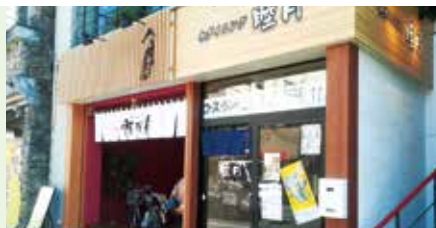
② 和ダイニング睦月 (和食 居酒屋・広小路町13・3)