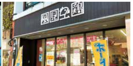
③ 風見鶏 (ボードゲーム専門店 / 中央町3・45)