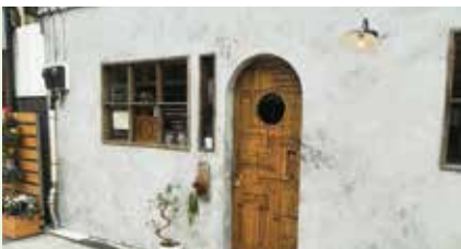
① WEDNESDAY COFFEE STAND (カフェ / 芝本町7・5)