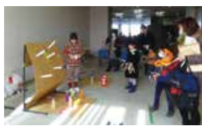
▲子ども会フェスティバルで手作りゲームコーナー運営