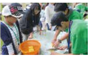
▲仲間と一緒に自ら行動できる人を目指そう！

場 生涯学習センターなど 費 2,500円※宿泊代、食事代、保険代、Tシャツ代など 対 市内在住の小学5・6年生 定 30人※応募者多数時抽選